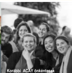
Korábbi ACAY önkéntesek