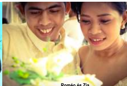
Roméo és Zia